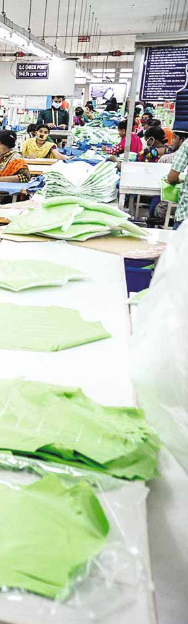
Produktionsbereich einer Textilfabrik in Bangladesch, die für ALDI produziert und am AFA Project teilnimmt.