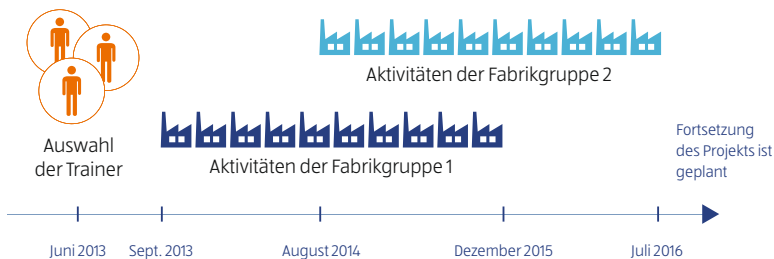
Abb.: Zeitleiste der Aktivitäten während der ersten drei Jahre des Projekts